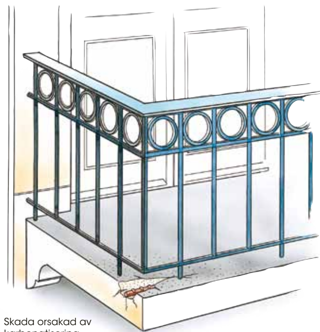
Skada orsakad av karbonatisering.

Korrosionsbenägna metaller ska först skyddas med rostskyddsfärg. Underlaget ska vara rent och fritt från lösa, porösa eller feta föroreningar. Gammal löst sittande färg ska tas bort. Underlaget ska vara torrt och ha god hållfasthet. Betong med mycket slät struktur eller porös yta grundas med outspädd Mineralux 8269 Betongfärg Grund. Betong som har god hållfasthet och är lite småruggig behöver ej grundas.